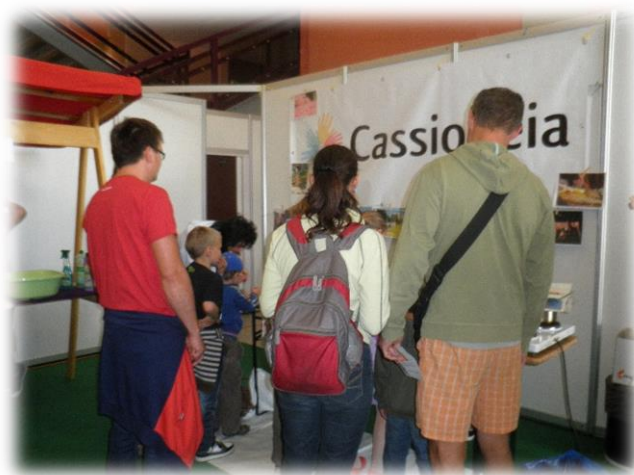
EKOLOGICKÝ DEN 1.9.2013

1.9.2013, při příležitosti konání Výstavy Země Živitelka 2013, Výstaviště České Budějovice