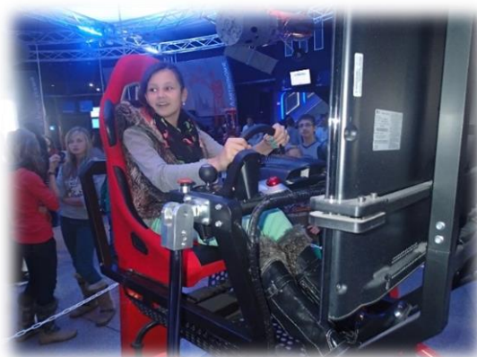
ZŠ VACOV EXKURZE PLANETÁRIUM 23.11.2013