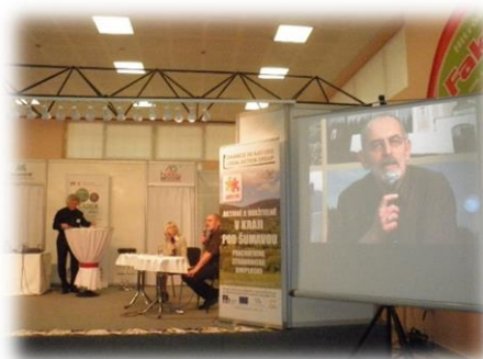
MEDIÁLNÍ DEN NA VELETRHU HOBBY 2013