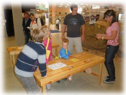
EKOLOGICKÝ DEN 2013

Zdroje financování: Operační program Vzdělávání pro konkurenceschopnost, MŠMT