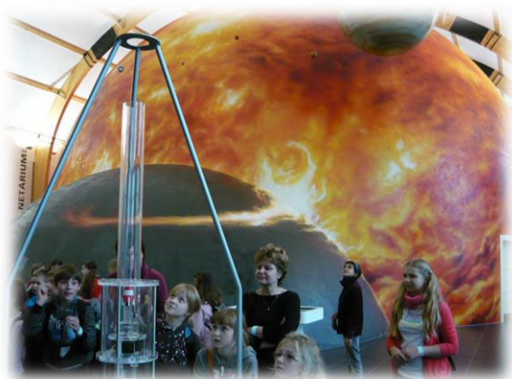
ZŠ MALENICE EXKURZE PLANETÁRIUM 20.11.2013

Zdroje financování: Operační program Vzdělávání pro konkurenceschopnost prostřednictvím Jihočeského kraje