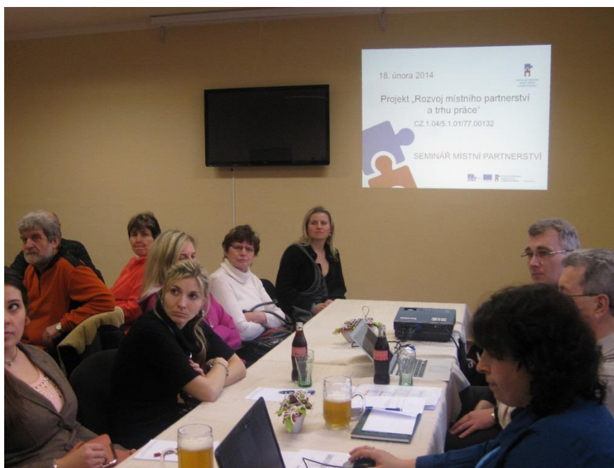
SEMINÁŘ MÍSTNÍHO PARTNERSTVÍ

Zdroje financování: z prostředků ESF prostřednictvím Operačního programu Lidské zdroje a zaměstnanost a státního rozpočtu ČR